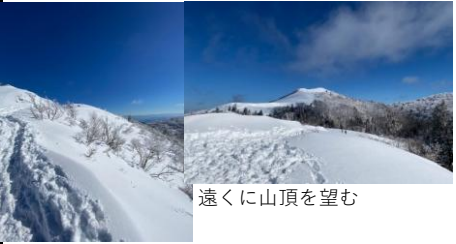
遠くに山頂を望む