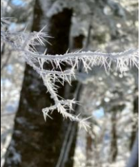
見事な”樹霜”が辺り一面に！