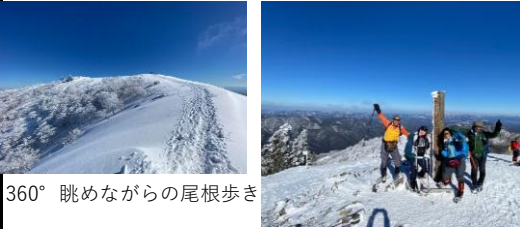
360° 眺めながらの尾根歩き